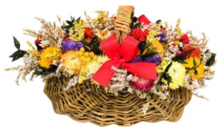
Sving egen 2/34 - 2

Glæd jer til legestuen den 30. oktober, hvor vi forhåbentlig bliver rigtig mange dansere og med levende musik.