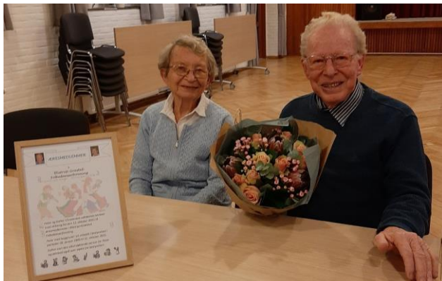
Sving egen 3/34 - 6