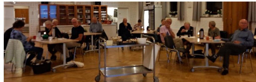
Sving egen 3/34 - 3